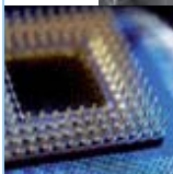
Microélectronique et Nanoélectronique